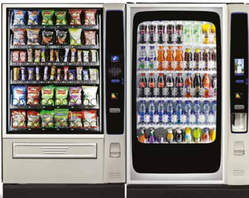
MERCHANT MEDIA 6 KEYPAD