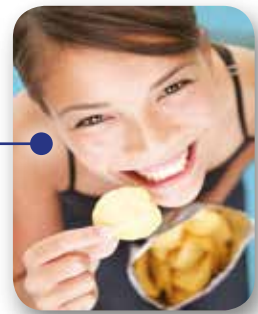
BEVMAX MEDIA 45 SELECT TOUCH